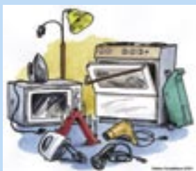
Exempel på el-skrot med producentansvar